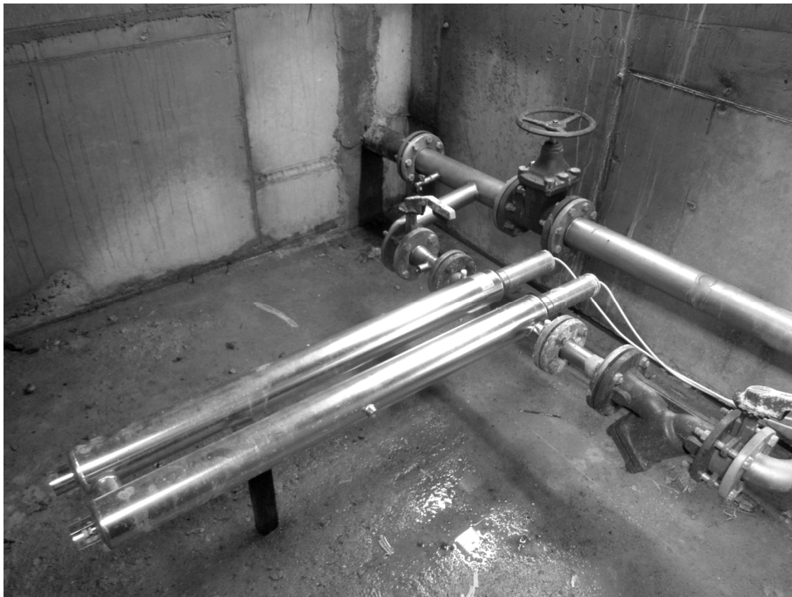
Obr. 2. UV zářiče DESUVA UV-N 50 2 x 75 W

provozovatele kontaktován starosta obce, který vystaví objednávku na provedení servisních prací dodavatelskou firmou. Provedené úkony a spotřebovaný materiál jsou následně uhrazeny z obecního rozpočtu mimo standardní režim vodného. Výrobce uváděná životnost výbojek je zhruba 10 000 hodin (14 měsíců), jejich fyzická výměna probíhá zhruba s jednoročním intervalem.